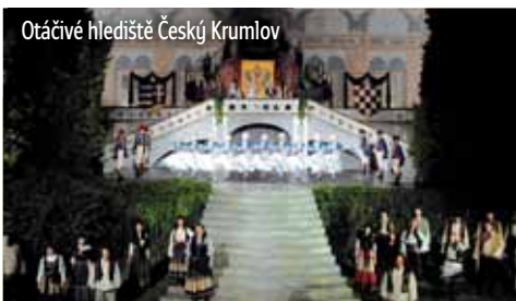
Otáčivé hlediště Český Krumlov

* Balíček místo oběda i večere (pouze pro klienty, kteří mají polopenzi či plnou penzi zahrnutou v pobytu v lázních - nutno vyzvednout u snídaně). Zájezdy se uskuteční při 30 platících účastnících. Přihlášky a platby zájezdů v Infocentru Lázní Aurora a v kulturním oddělení Bertiných lázní ve čtvrtek do 16.00 hodin před každým zájezdem, ve středu do 16.00 hodin u zájezdů na otáčivé hlediště do Českého Krumlova. CK GEOTOURIST je pojištěna ve smyslu zákona 159/1999 Sb. u GENERALI POJIŠTOVNY, a. s.