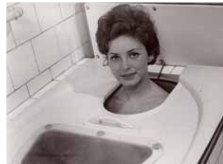
↑ Rekonstrukce lázní umožnila provozování nových procedur, například cvičení v bazénu nebo uhlíčitě koupele.